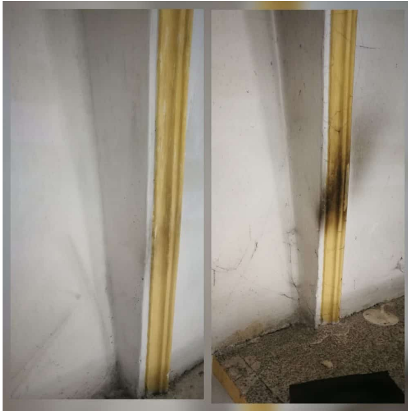
Verschmutzte Stuckaturen durch die Hitze der Lampen auf den Gesimsen im Gewölbe.