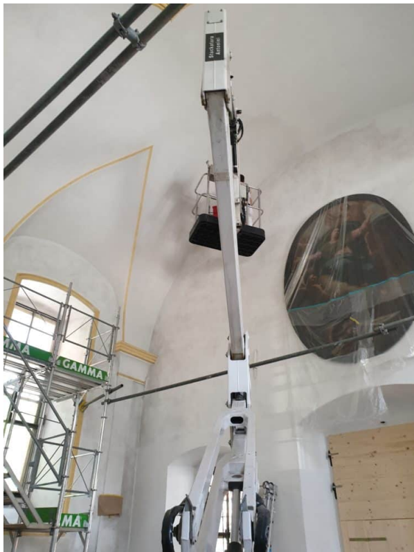
die Gesamte Kapelle wird mit Keim Quarzil 1 mal Lasieret.