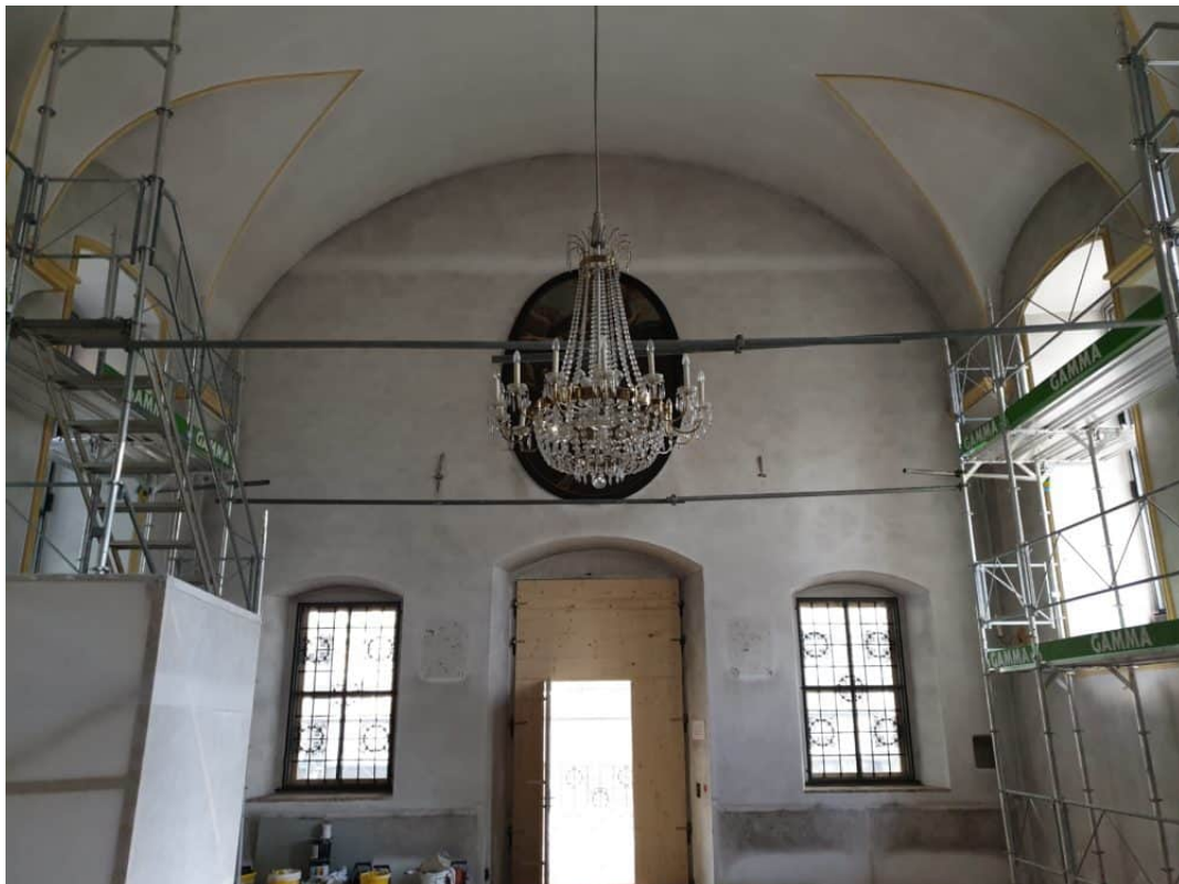
Ansicht der verschmutzten Rückwand der Kapelle