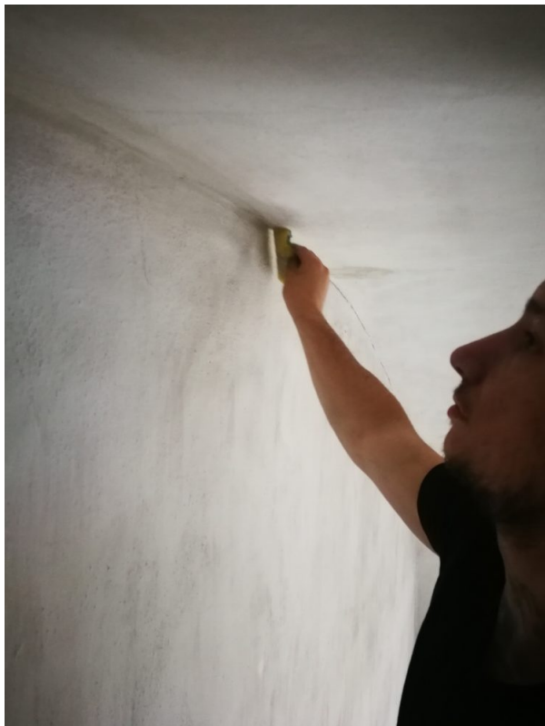
Zuputzen der Risse mit Artgerechtem Material.