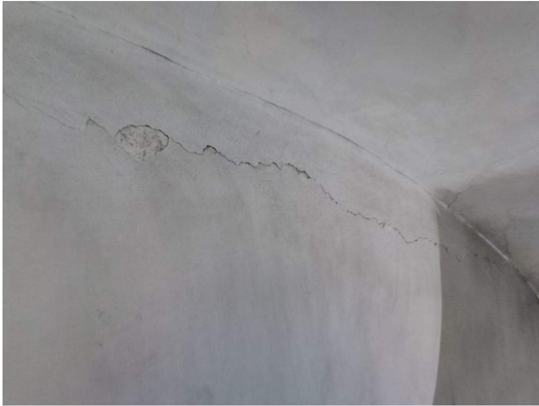
Risse und Flickstellen werden mit Artgerechtem Material geflickt.