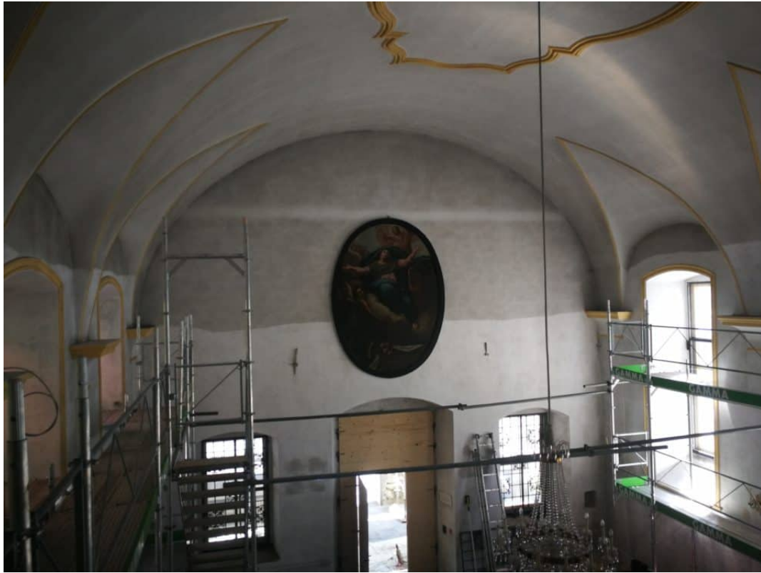
Rückwand der Kapelle ist zur Hälfte Trockengereinigt