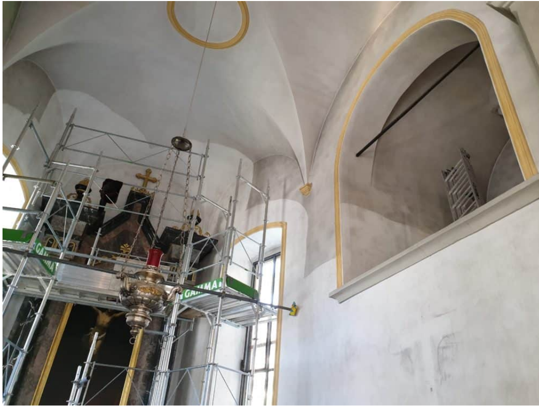
Trockenreinigung im Chorraum.