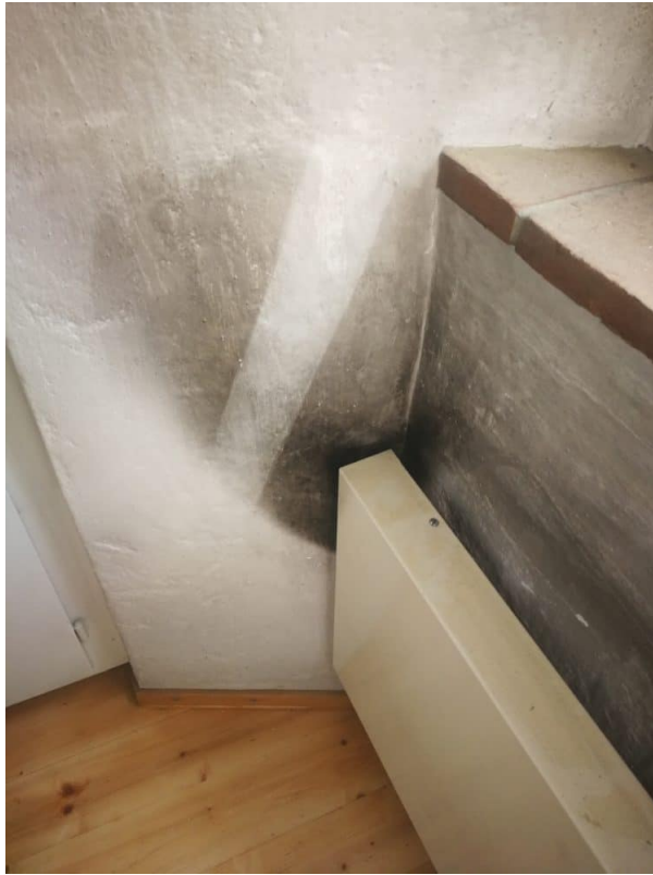
Starke Verschmutzung bei der Heizung.