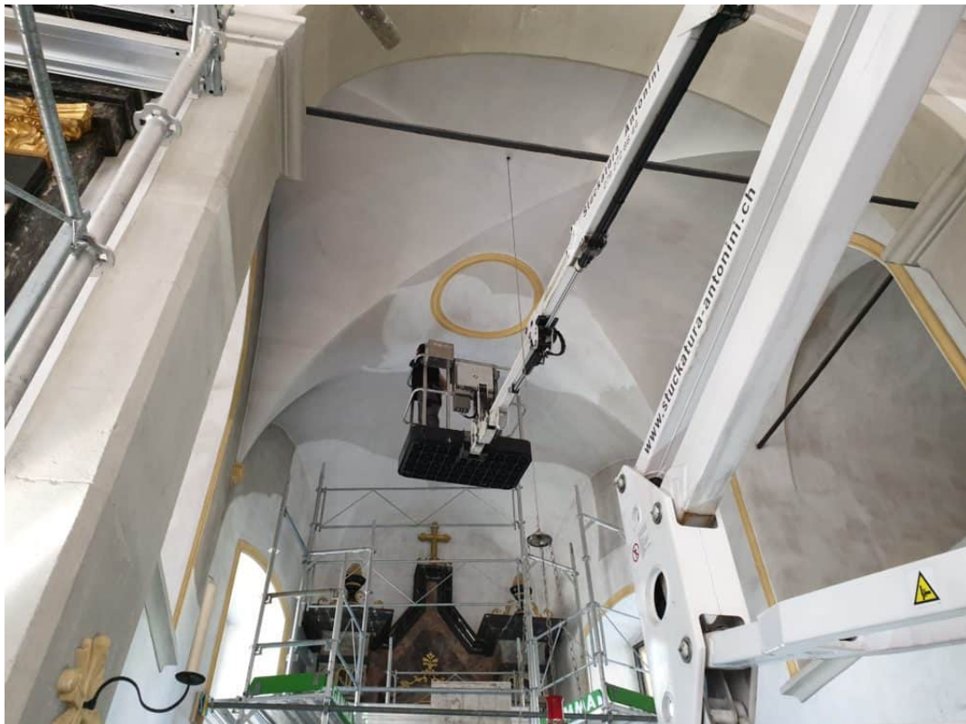
Die gesamte Kapelle wird zuerst Trockengereinigt und anschliessend 1 mal mit Keim Quarzil Lasiert.