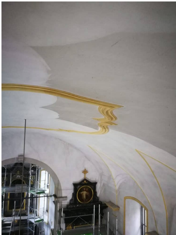
Trockenfreilegung am Gewölbe.