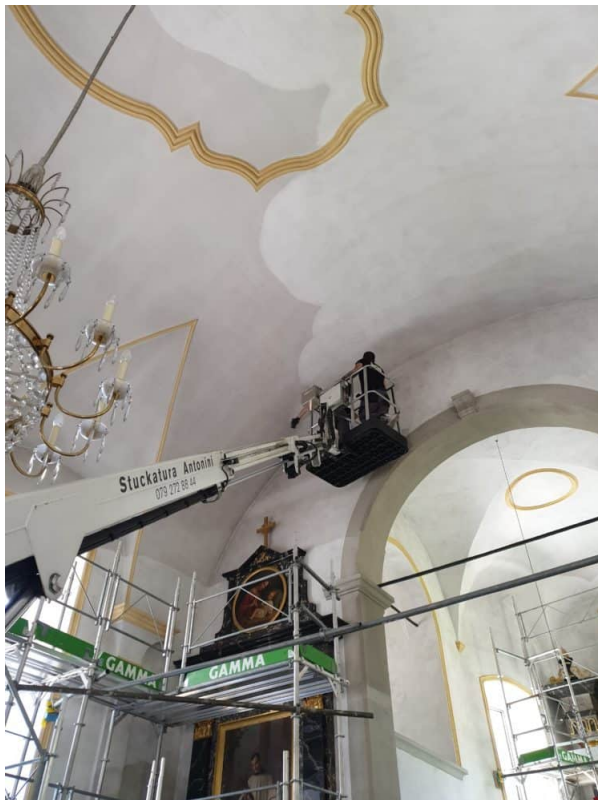
Trockenreinigung mit der spez. Hebebühne am Gewölbe und Chorbogen.