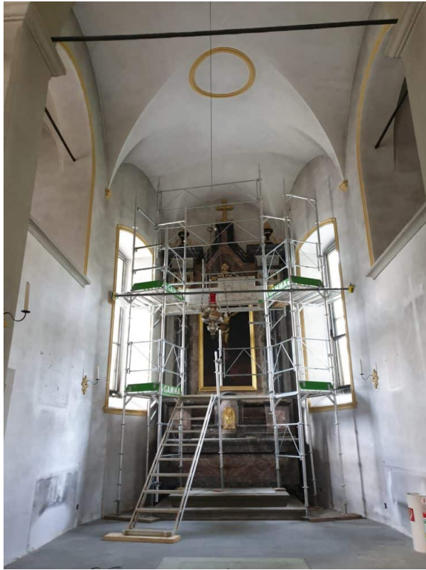
Die Kapelle Unterheiligkreuz ist mit einer starken Patina Schicht überzogen.