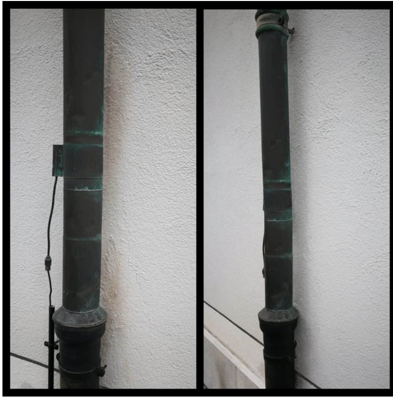
Vorher / Nachher