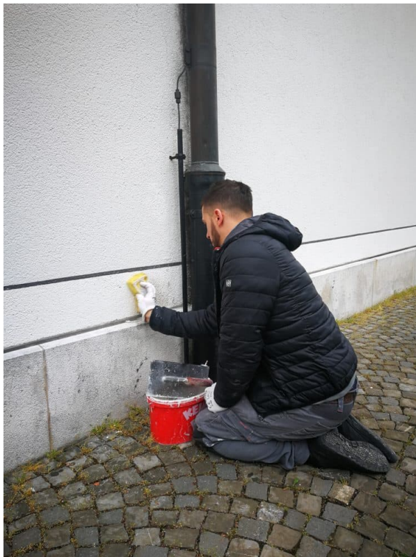
Anpassung an bestehende Struktur.