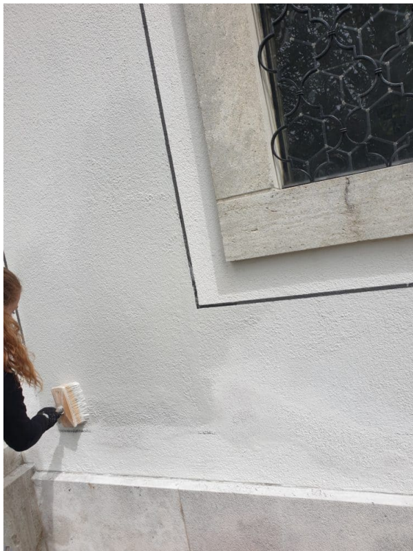
Anpassen der Farbe und örtliches Ausretuschieren. mit Keim Granital Mineralfarbe