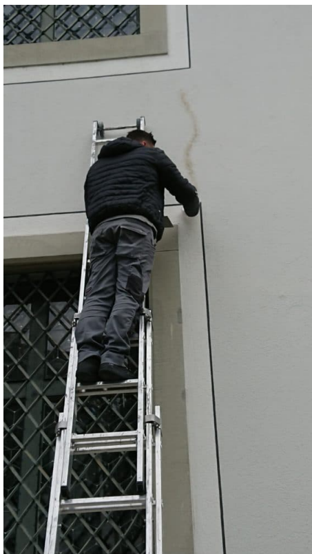
Kleinere Risse werde mit Mineralischem Material zugespachtelt.