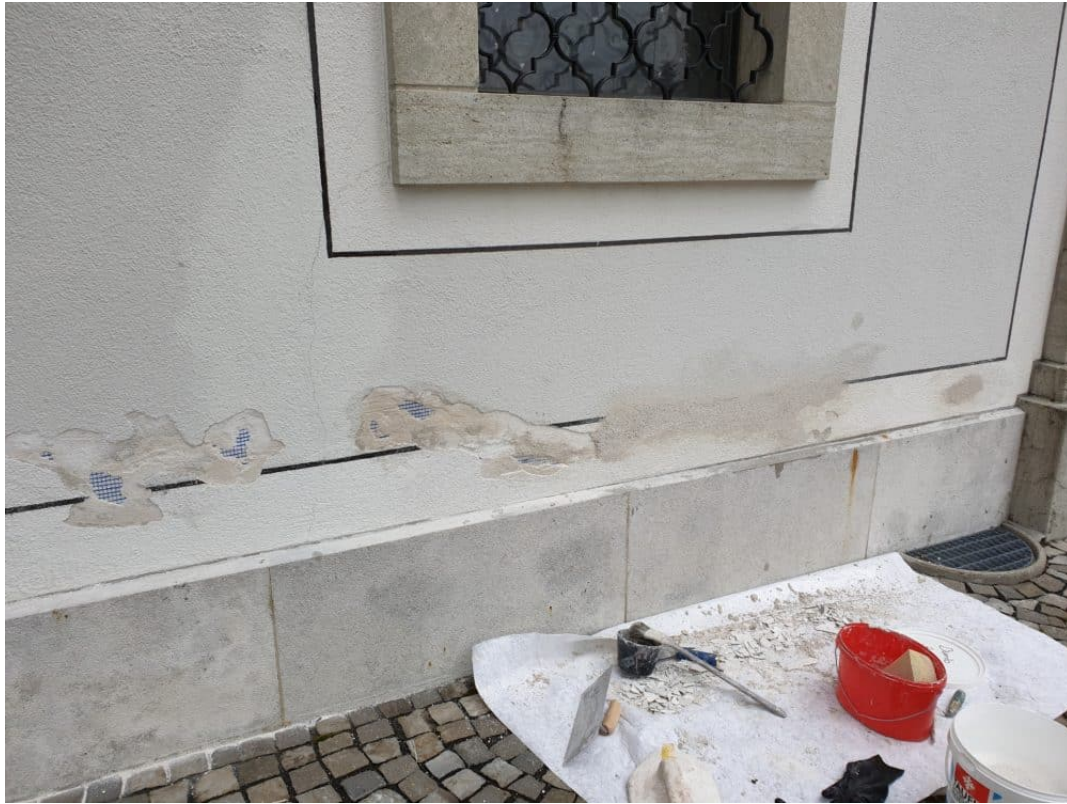
Zuputzarbeiten mit gleichem artgerechtem Material 2 mm Korn Mineralisch.