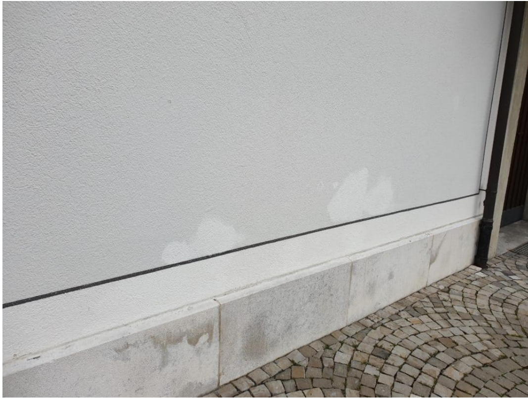
Vorher: Nachbesserung der Farbretuschen, Angleichung an bestehende Farbe.