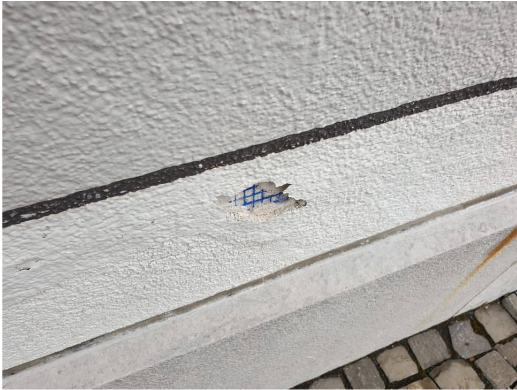
Abstossen der losen Putzteile, an der Aussenfassade beim Haupteingang.