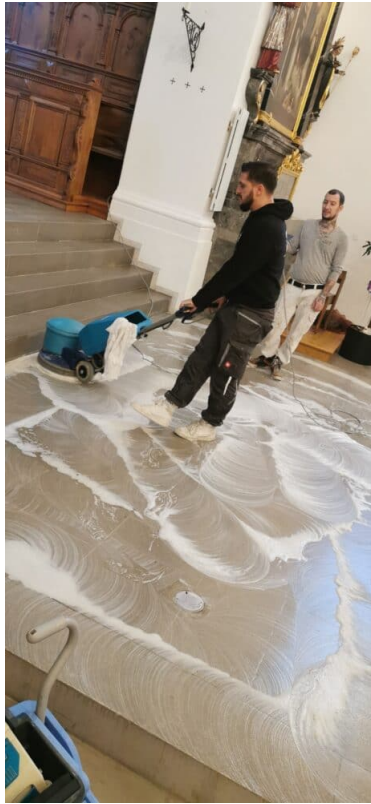
Reinigen des Sand Steinbodens im Gesamten Kirchen innen Raum mit der Einschiebe Maschine.