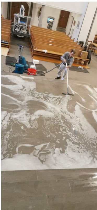
Anschliessend mit dem Nassstaubsauger die Verschmutzung aufsaugen.