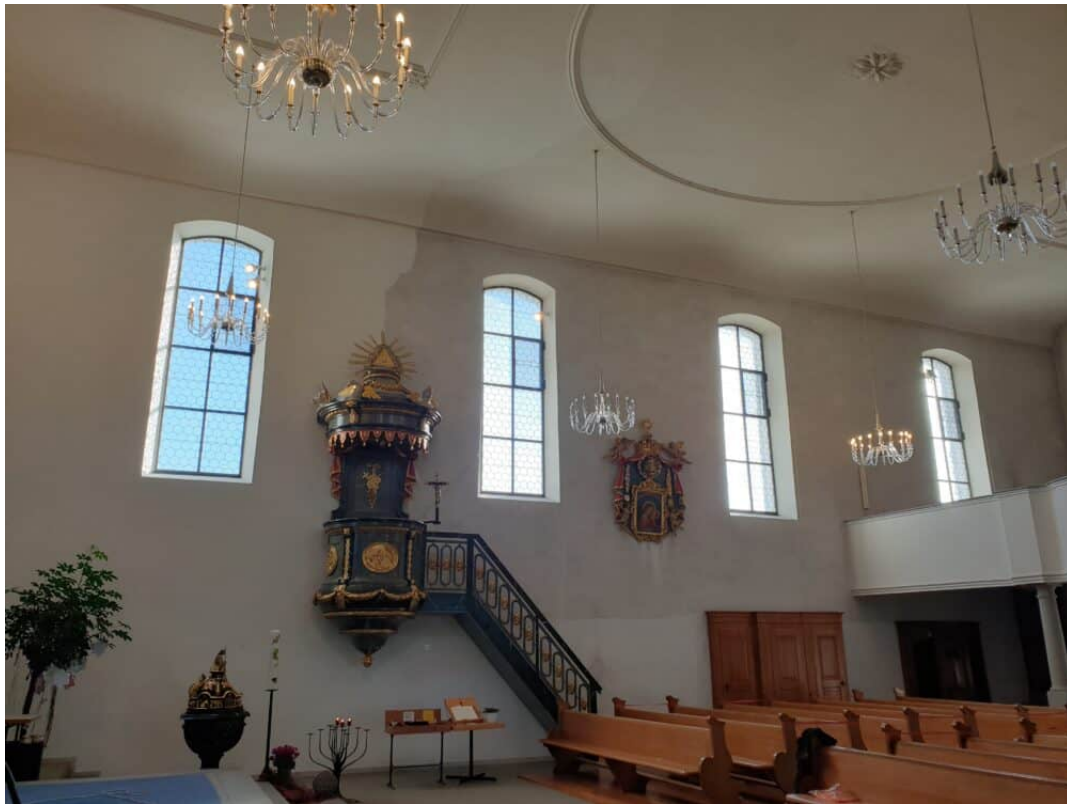
Ansicht Schiff (Langhaus): Unterschied links gereinigt / rechts verschmutzt