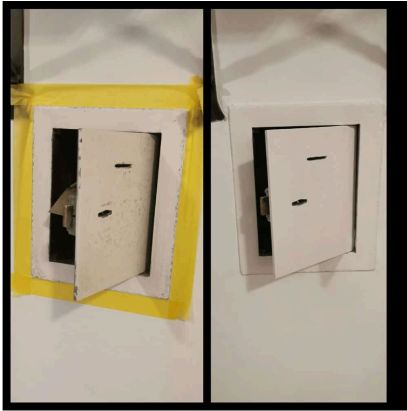
Ansicht Opferstock Kässeli Vor und Nachher