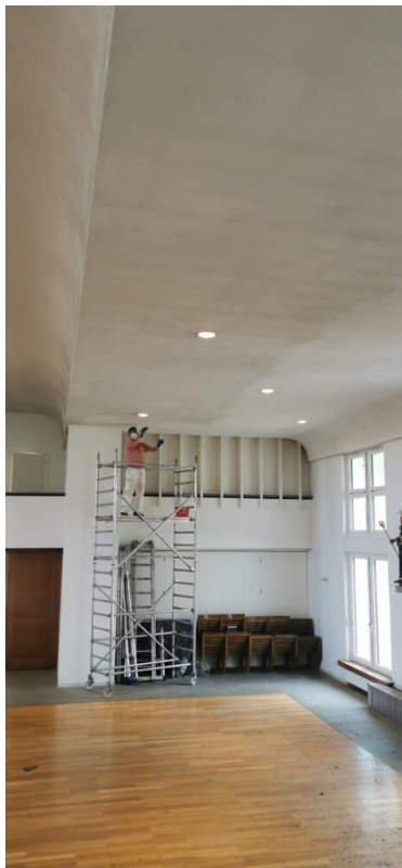
Ansicht Seiten Anbau Kirche: Trockenfreilegung der Akustikdecke.