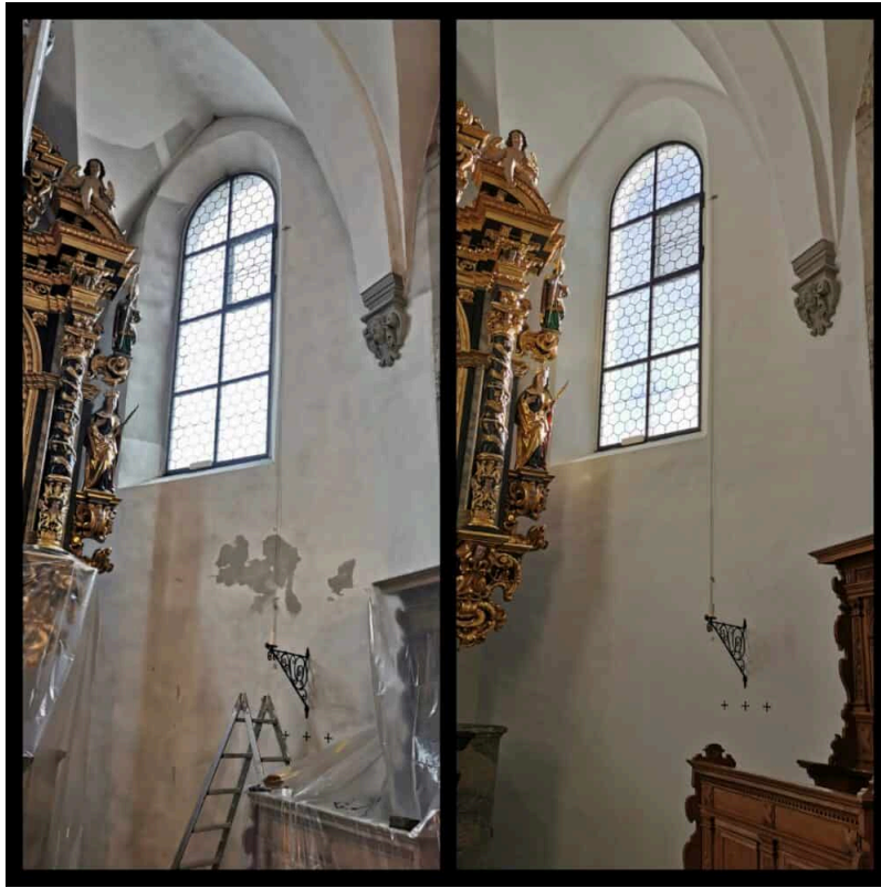
Ansicht Chorhaus Vor und nachher.