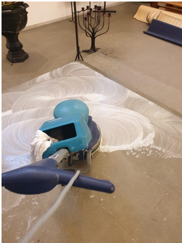
Reinigen des Sand Steinbodens im Gesamten Kirchen innen Raum mit der Einschiebe Maschine.