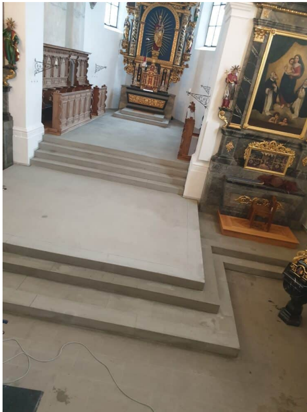
Ansicht Unterschied des gereinigten Sand Steinbodens im Chorraum.