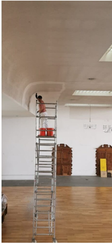
Ansicht Seiten Anbau Kirche: Trockenfreilegung der Akustikdecke.