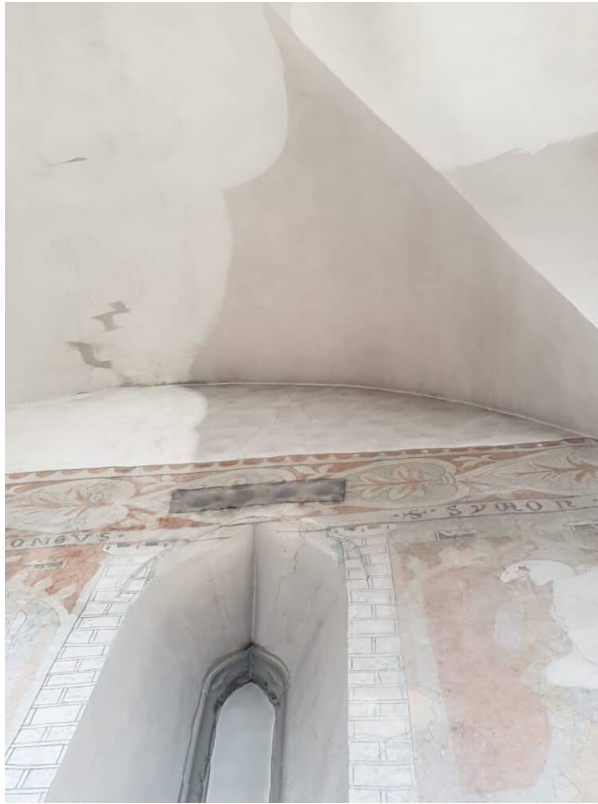
Ansicht Chorhaus: Trockenfreilegung mit Walmaster Gummis über alle Wand und Gewölbe Flächen. Vorsichtiges Reinigen bei Fresken.