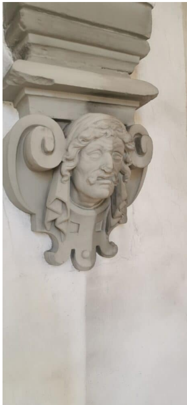
Ansicht Schlussstein: links gereinigt / rechts verschmutzt