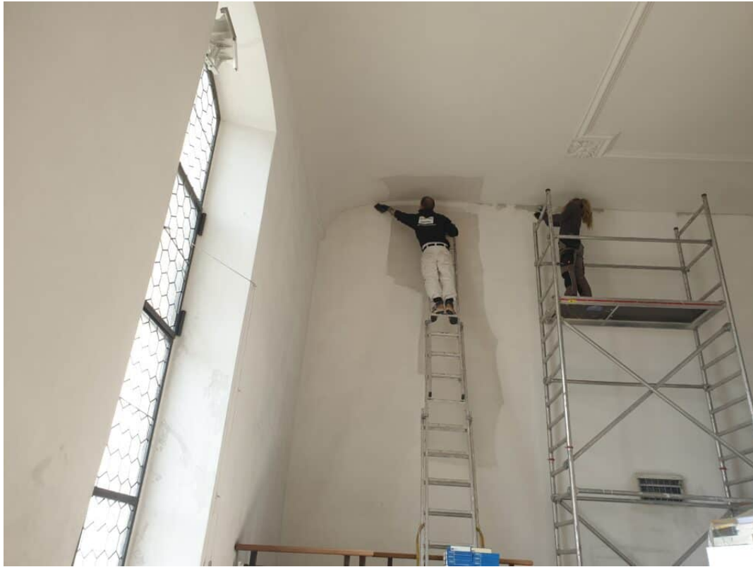
Ansicht Orgelepore Trockenfreilegung der Rückwand.