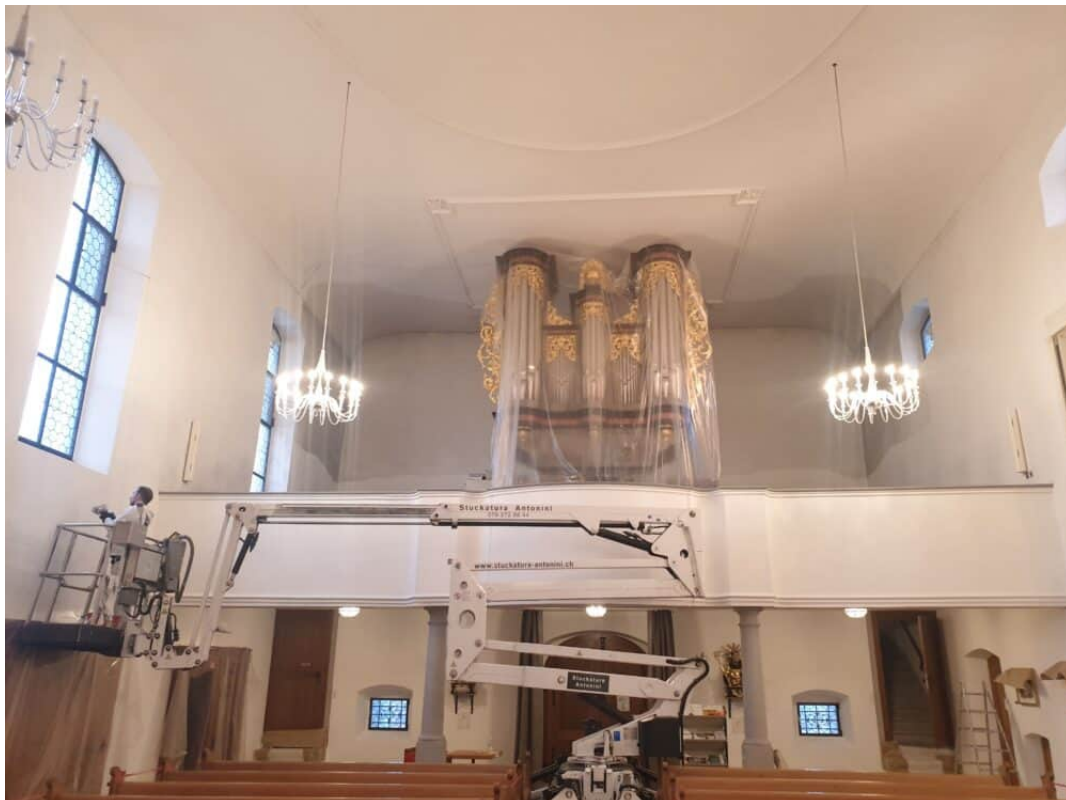
Ansicht zur Orgel Empore Trockenfreilegung der Verschmutzung (Patina)