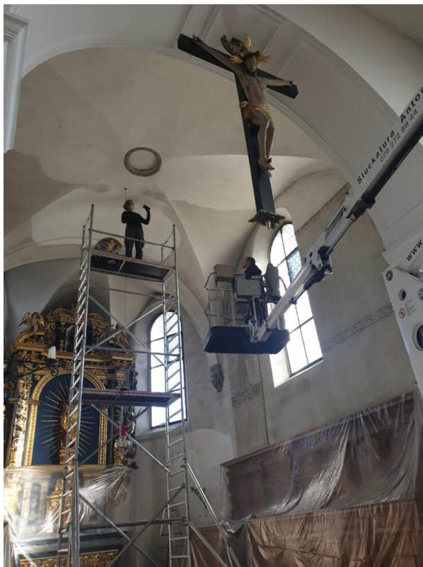
Ansicht Chorhaus: Trocken Freilegung der Patina (Verschmutzung).