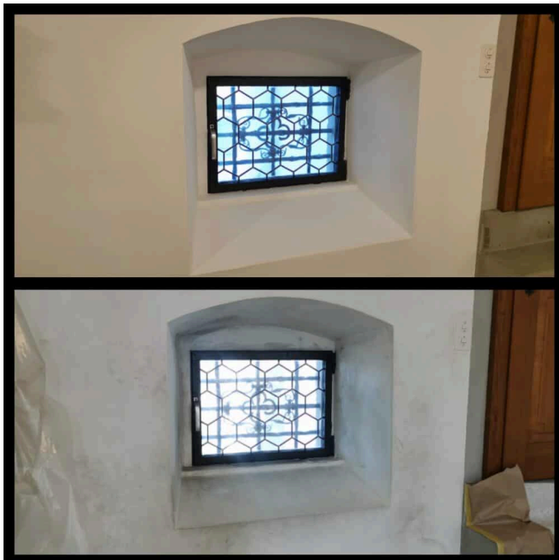
Ansicht Haupteingang Vor und Nachher