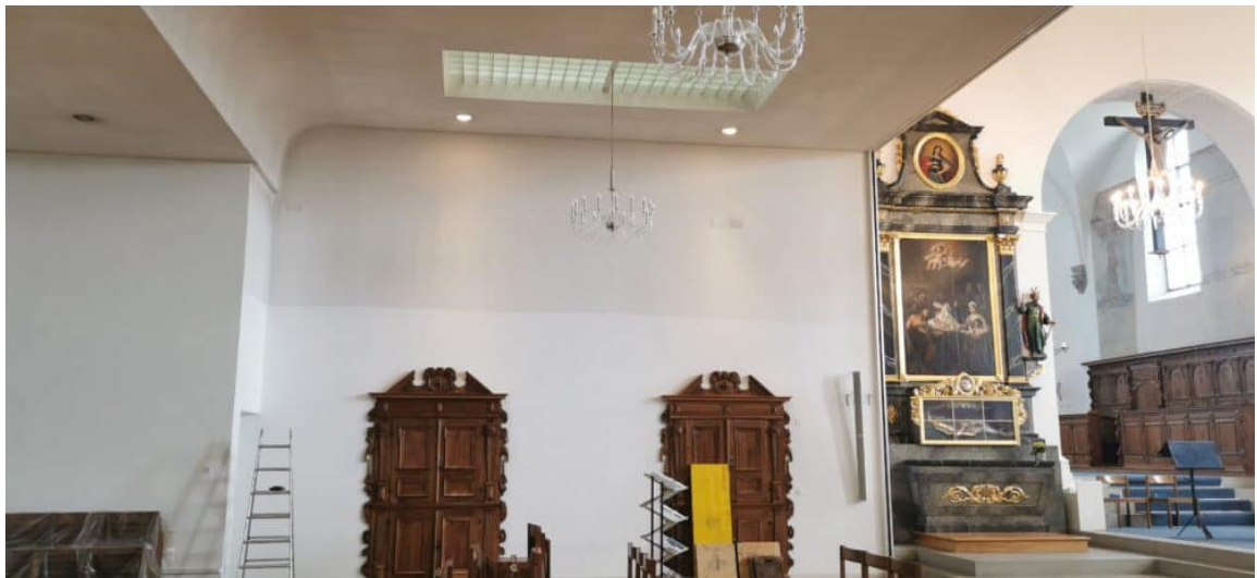
Ansicht Seiten Anbau Kirche Trockenfreilegung der Wände.