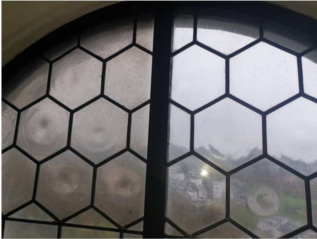
Fenster Reinigung Innen: Rechts verschmutzt / links gereinigt.