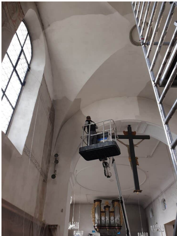
Ansicht Freilegung der Verschmutzung.