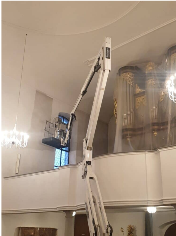
Ansicht zur Orgel Empore Trockenfreilegung der Verschmutzung (Patina)