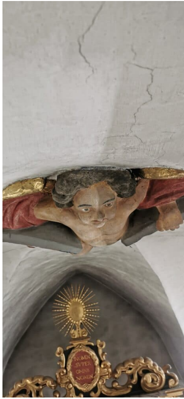
Ansicht Engel am Gewölbe im Chorhaus: links gereinigt / rechts verschmutzt