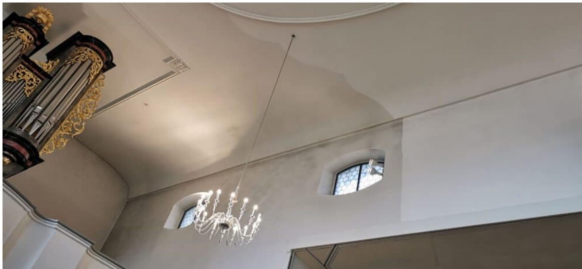
Ansicht zur Orgel Empore Trockenfreilegung der Verschmutzung (Patina)