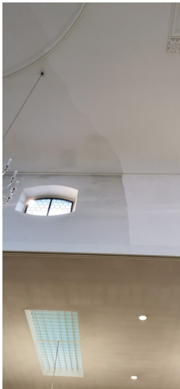
Ansicht Schiff (Langhaus) unterschied der Verschmutzung an der Geraden Decke und Aussenwände.