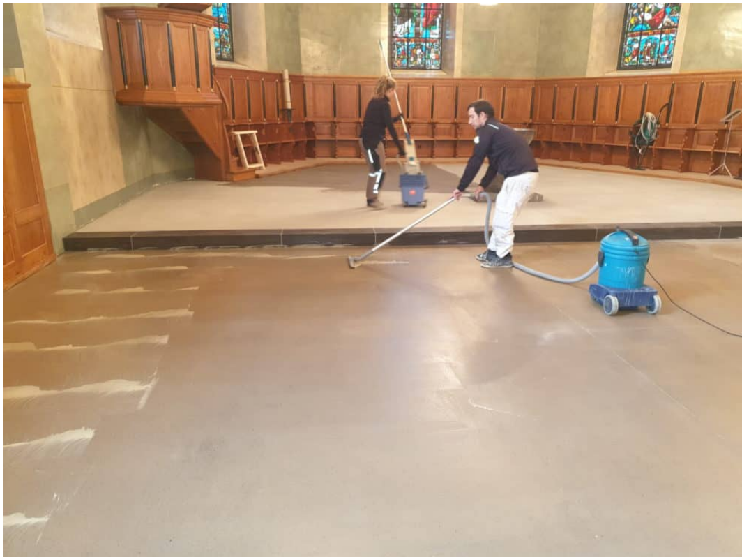
Ansicht: Mehrfaches nachreinigen und aufsaugen.