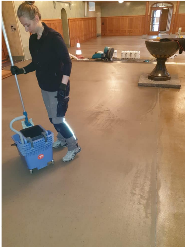
Ansicht: Mehrfaches Aufnehmen des Anhydrit Unterlagsboden mit Klarem Wasser.