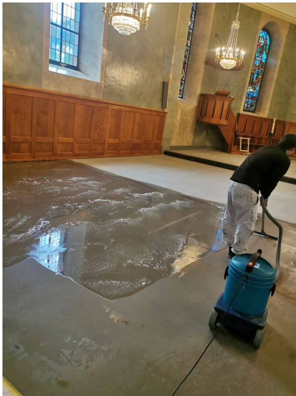
Ansicht: nachspülen mit klarem Wasser.