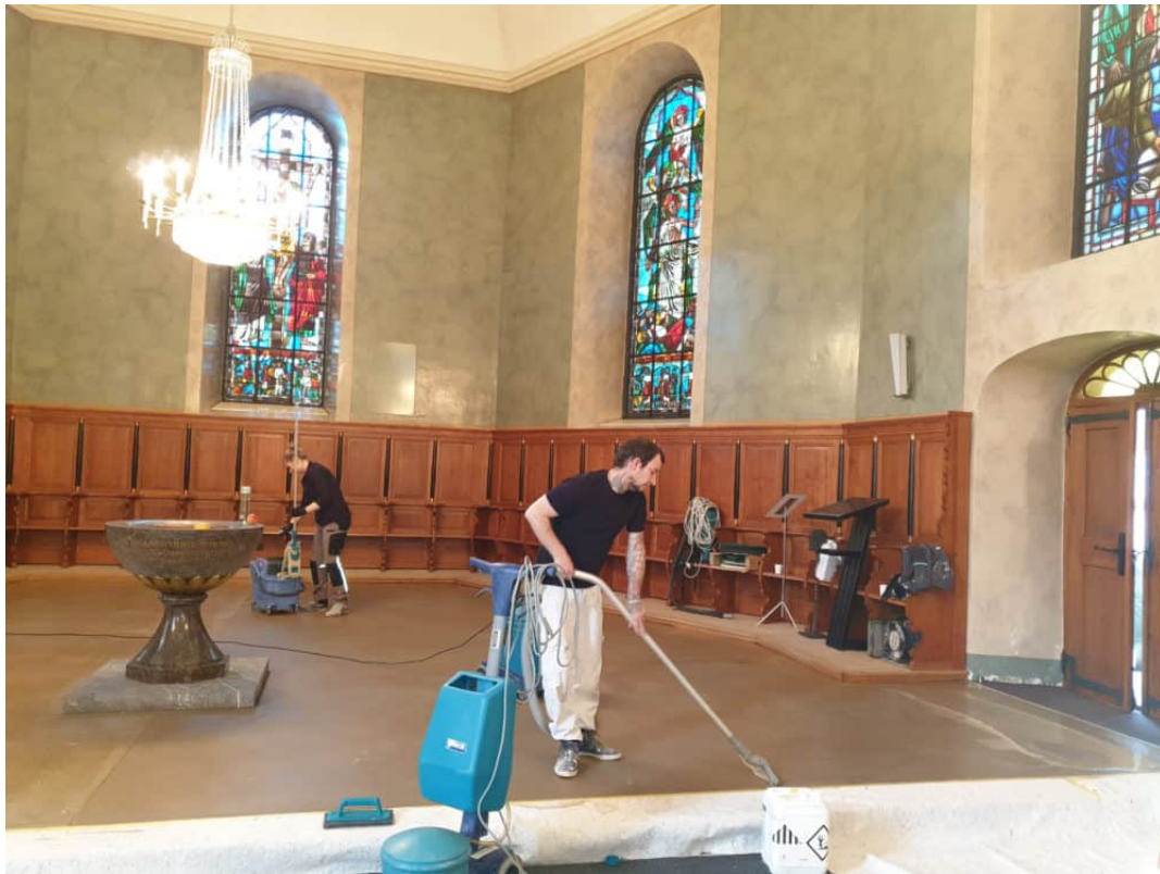
Ansicht Chorhaus: Reinigung des Anhydrit Unterlagsboden entfernen der alten Versiegelungsschichten und Verschmutzung.