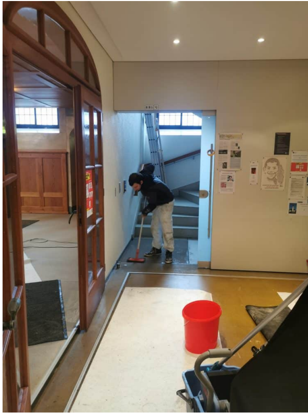
Ansicht Eingangsbereich: Von Hand abtragen der Versiegelung und nachreinigen.