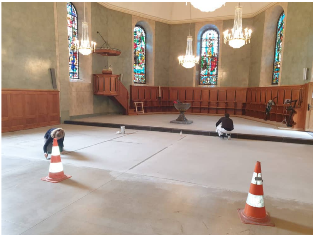
Reinigungsarbeiten an den Anschlüssen und Fugen.