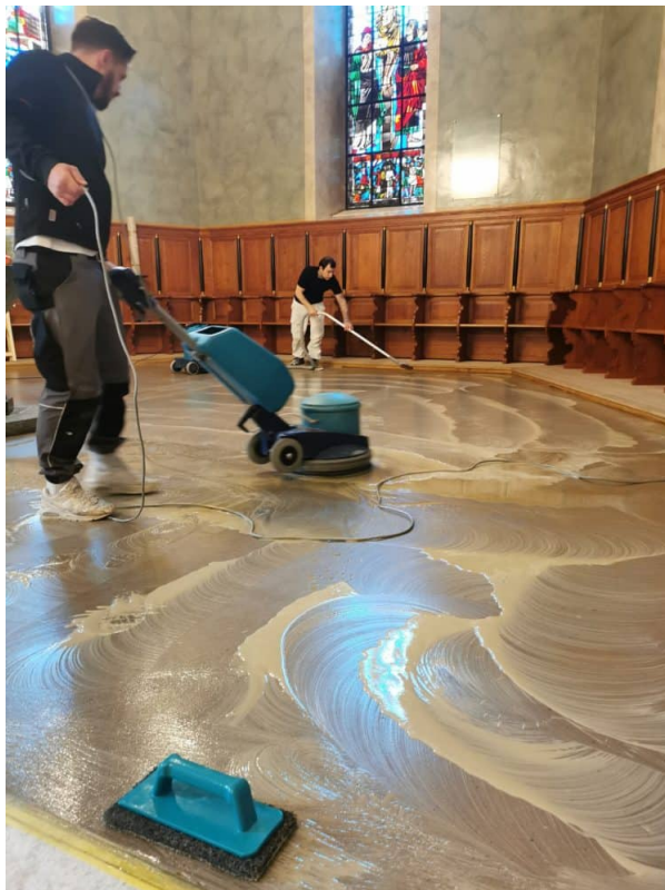
Ansicht : Bodenreinigung mit der Einscheibemaschine auftragen von Remate Fotrte, anschliessend 2X Antiwax und mehrfaches nachreinigen mit klarem Wasser.