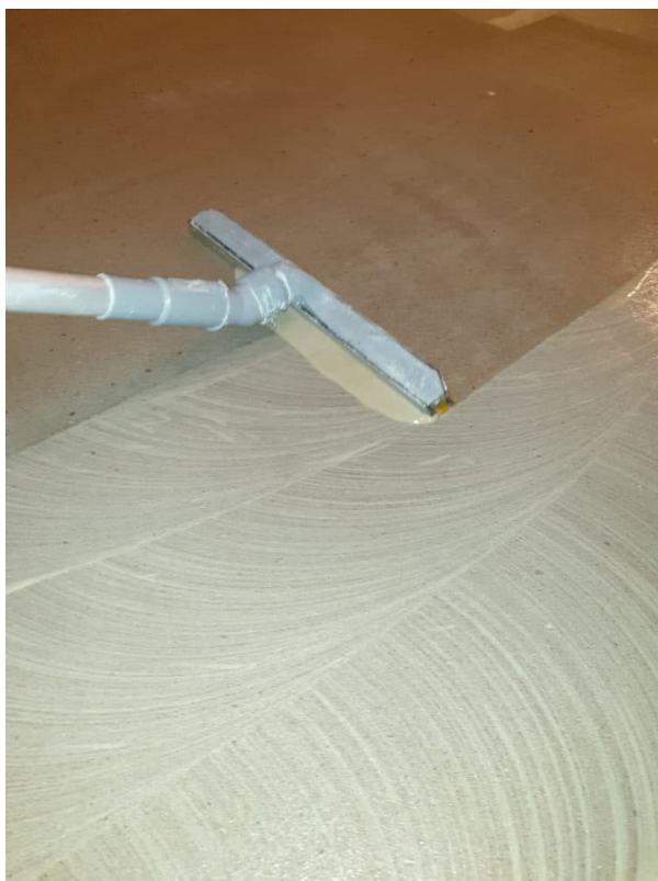
Ansicht: Absaugen der Verschmutzung und Versiegelungsschicht.