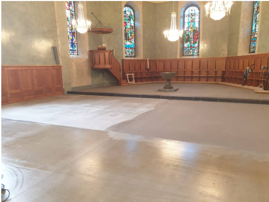
Ansicht: Abtrocknen des Anhydrit Bodens