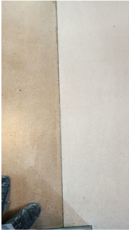
Ansicht Bemusterung vom 11. März 2020. (Vorher / nachher)