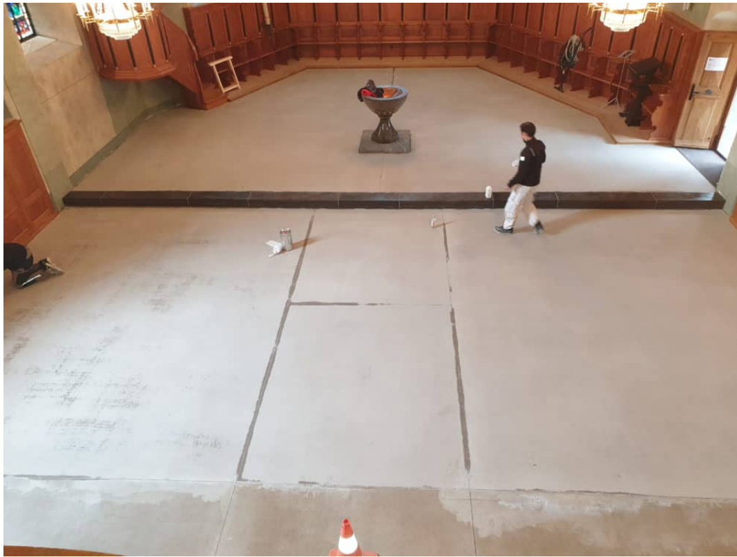
Ansicht von Oben: die Hälfte des Anhydrit Bodens ist gereinigt.