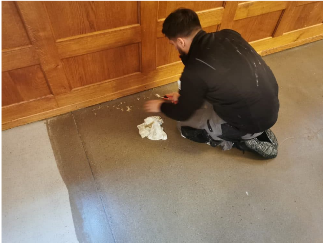
Ansicht: abkratzen der Versiegelung unter den Holzbrüstungen.